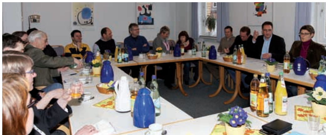
Blick in die Teilnehmerrunde der Jahresversammlung des Bezirksverbandes Braunschweig.