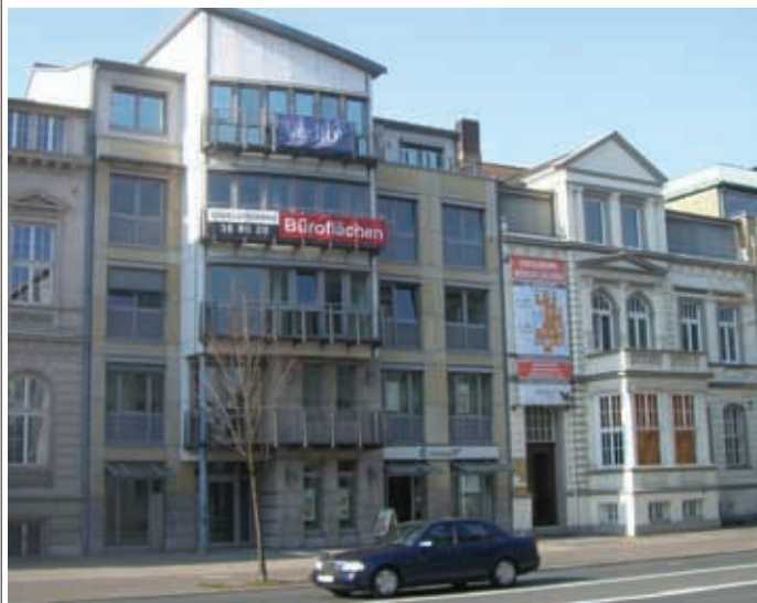
Das spart: Sitzungen und Veranstaltungen finden größtenteils in der Geschäftsstelle des Landesverbandes statt.